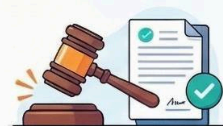
การประเมินผล เน้นตัดสินคุณค่าและผลสำเร็จ